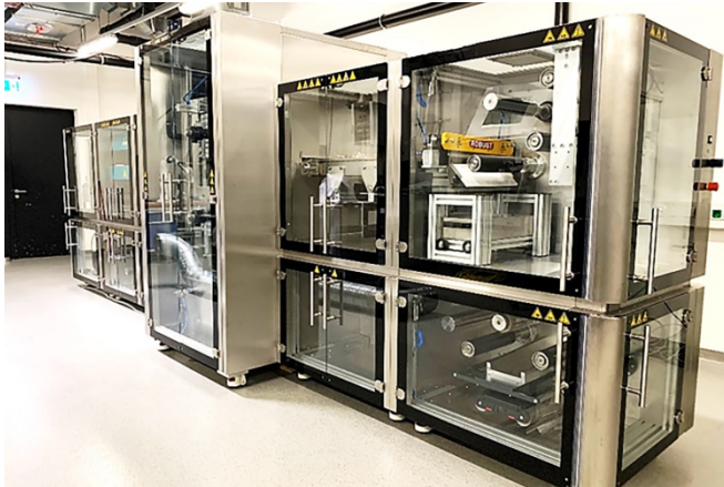
Bild 2: Ab Sommer 2021 werden am Fraunhofer ILT Laserprozesse für die Batteriefertigung in einem eigenen Batteriezentrum erforscht. Im Bild: Rolle-zu-Rolle Anlage.