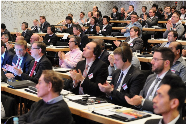
Bild 1: Rund 200 Teilnehmer diskutierten auf der »5. Conference of the International Center for Turbomachinery Manufacturing ICTM« unter anderem über produktiven Umweltschutz.

----- PRESSEINFORMATION 14. März 2019 || Seite 3 | 3 -----